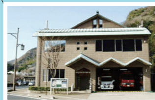
いず も しょう ほう しょ さだ ぶん しょ 出雲消防署・佐田分署