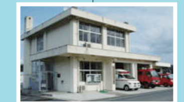
いず も に しょう ほう しょ た き ぶん しょ 出雲西消防署・多伎分署