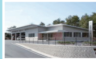
いず も に しょう ほう しょ ほん しょ 出雲西消防署・本署