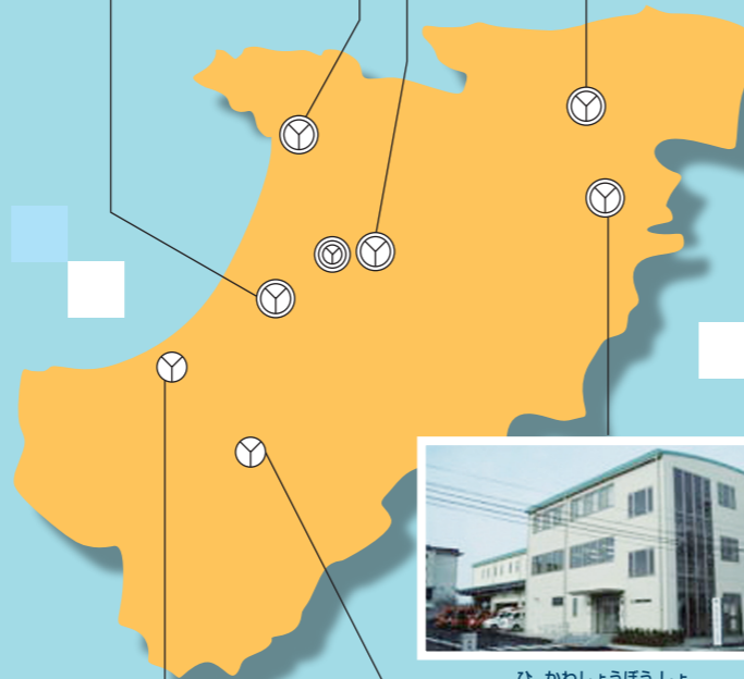
ひ かわ しょう ほう しょ 斐川消防署