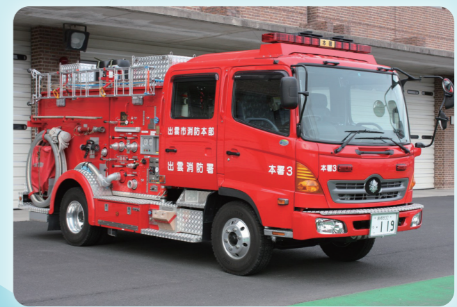
すい そう つき しょう ほう じ どう しゃ しゃ 水槽付消防ポンプ自動車(タンク車)

しょう ほう たい の くろ ま しょう ほう しゃ の ほう すい おこな 消防隊が乗る車。消防車からホースを延ばして放水を行います。