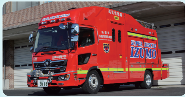
きゅう じょ こう さく しゃ こう さく しゃ 救助工作車(工作車)

きゅう じょ たい の くろ ま しょう めい そう ち きゅう じょ かつ どう 救助隊が乗る車。クレーン、ウインチ、照明装置など救助活動 で使用する道具を積んでいます。