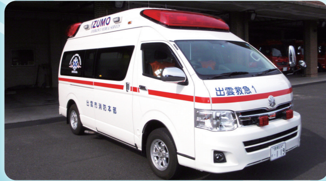
きゅう きゅう じ どう しゃ きゅう きゅう しゃ 救急自動車(救急車)

きゅう じょ たい の くろ ま しょう めい そう ち きゅう じょ かつ どう 救助隊が乗る車。クレーン、ウインチ、照明装置など救助活動 で使用する道具を積んでいます。