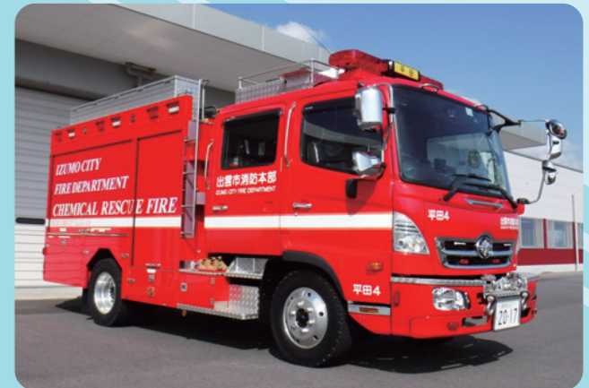
か がく しょう ほう じ どう しゃ か がく しゃ 化学消防ポンプ自動車(化学車)

しょう ほう たい の くろ ま しょう ほう しゃ の ほう すい おこな 消防隊が乗る車。消防車からホースを延ばして放水を行います。