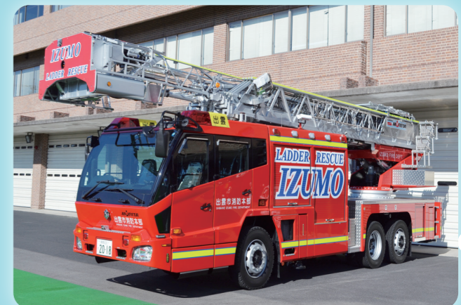
たき しょう ほう じ どう しゃ しゃ はしご付消防自動車(はしご車)

しょう かく やく ざい あわ だ みず だけ しょう かく 消火薬剤(泡)を出すことができ、水だけでは消火することが むずか かい ほう すい おこな 難しい火災で放水を行います。(出雲西消防署本署・平田消防署に配備)