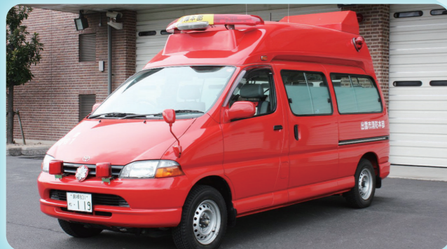
し れい しゃ 指令車

か さい げん ば きゅう じょ げん ば じょう ほう じょう じゅう しょう ほう たい きゅう じょ たい 火災現場や救助現場で情報収集をしたり、消防隊や救助隊に 指示を出したりする指揮隊が乗る車です。